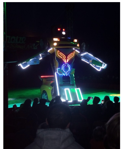
Performance d'un transformer au Cirque de Douai